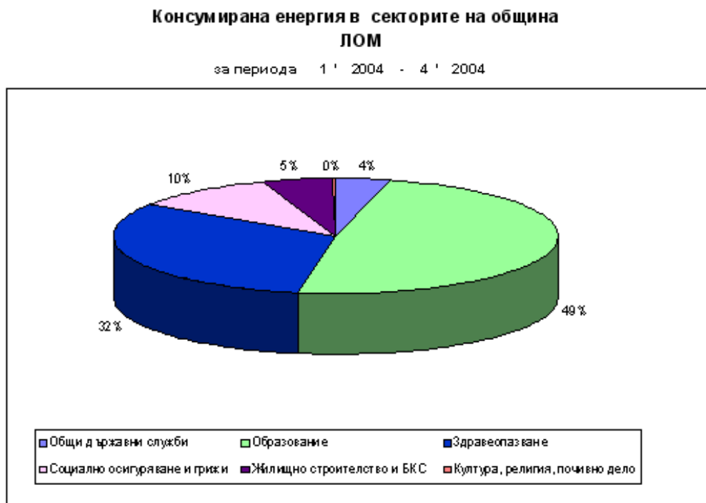
Графика 3. Консумирана енергия по общински сектори в община Лом

Енергопотреблението по общинските сектори се разпределя по следния начин: Образование – 49 %, Здравеопазване – 32 %, Социално осигуряване и грижи – 10%, Общи държавни служби – 4 % и Жилищно строителство и БКС – 5 %.